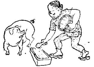
了惜可太猪養米用

飼料給生的好呢或是給煮熟的好？經多方面的試驗結果已證實，除剛斷乳的小豬及肥育末期的肥豬喂飼煮熟飼料稍佳外，其餘豬隻，喂生飼料與煮熟飼料，對豬隻發育沒有什麼差異，而且，飼料內許多維他命經過高熱時就會消失。現在農村燃料相當缺乏，如利用生飼料飼豬，不但可節省燃料，且