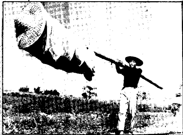
左、要配種的甘蔗，先要套上這樣一個大布籠。