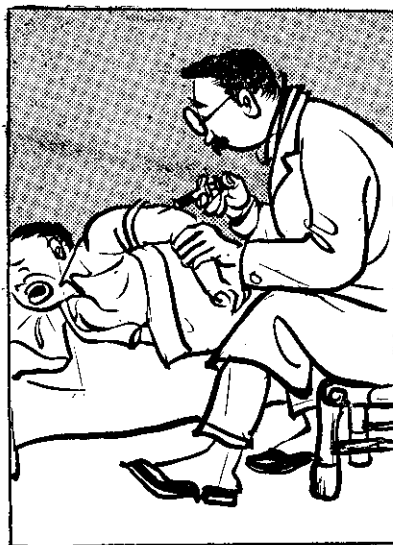
⑥ 醫生看診著正， 診察結果是腸炎， 趕緊食藥打針。 佳哉（幸虧）無危險。