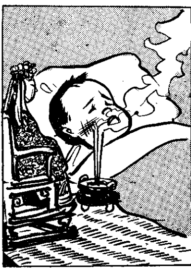
④ 魂結無果， 一日病沉， 阿毛發瘋， 迷信在實， 人害真。