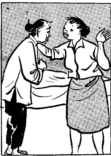
⑤ 一日阿姑（姑母） 起講迷信害人， 燒香收驚代志（事案） 趕緊請醫生來。