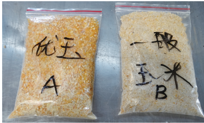
圖 1. A：優質蛋白玉米與 B：一般玉米。

行政院農業委員會農業試驗所 (以下簡稱農試所) 育成優質蛋白玉米 (圖 1) 經採收、烘乾儲存備用。試驗飼糧採用行政院農業委員會畜產試驗所 (以下簡稱畜試所) 飼料廠生產之產蛋前期配方配製飼料 (對照組)，處理組使用相同配方，其中玉米部分則以農試所育成之優質蛋白玉米取代。飼糧組成及主要營養成分計算值如表 1 所示，並依 AOAC (2000) 進行一般營養成分及必需胺基酸成分分析，包括進口一般玉米 (南美洲產)、優質蛋白玉米 (農試所產)、對照組飼糧及處理組飼糧等。