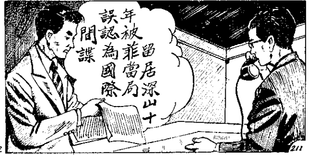
來出釋保人兩科，事領國中的顏賢三如通上馬，後告 報到接館使大菲駐國我