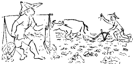
。種下才雨降等，地整先，期適種播到

影響收量。臺東區栽培高粱的農友，常因受螟害而失了栽培的興趣。高粱發芽後，要時常觀察，發現有凋萎的，即時拔起，或間拔時，特選凋萎心葉拔起，收集一堆燃燒。發芽後平均每隔八至九天，噴射