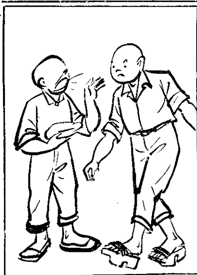
⑥ (農友們) 人田做家大勸奉 ? 空耳爬必何頭刺 ; 棕阿的憐可看請 。 (子驛) 人耳鼻甲撞空耳

④換句話說，飼料中經添加〇三%的「益生素」以後，確有促進雞生長，節省飼料消耗量的功效。