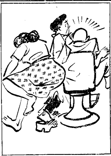
⑤ (心小不) 膩細無旁匆嫂發 ; 意注失急心時一 ; 去過撞邊身棕阿 。 (血流) 滴那血空耳 (得撞) 甲撞