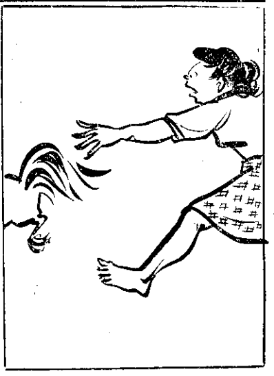
④ 去出飛雞闖隻一 ; 見看仔嫂發阿 ; 錢值真隻一雞闖 。 (牠) 伊追來緊趕嫂發