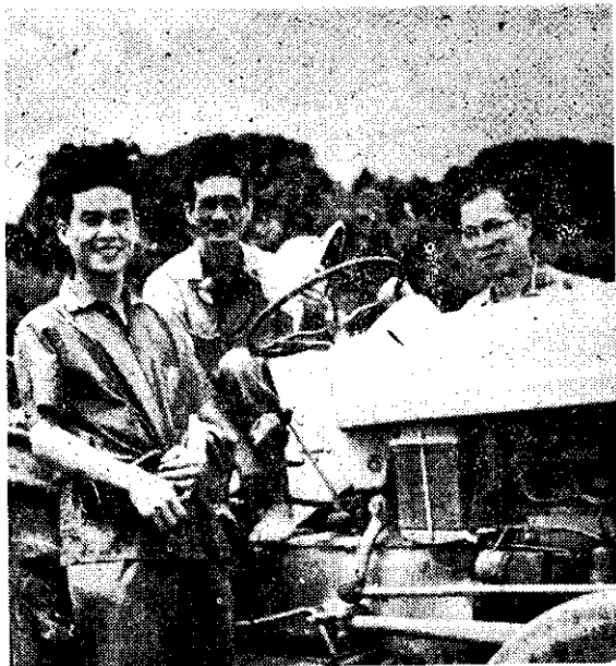
員導指陳，友農劉，者作文本：右至左由