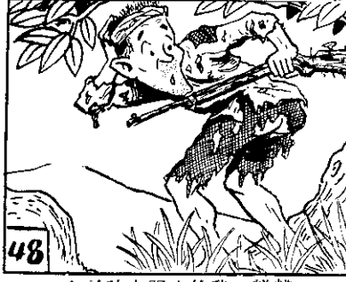
48 ！了破也服衣的我，糕糟