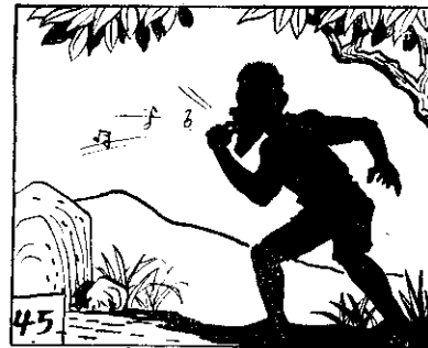
45 香回山空到聽只，狗叫哨口吹。拍駭人令