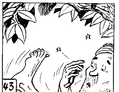
43 不，友朋：說醒驚夢士金李！人打要