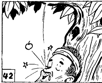
42 鼻的士金李在打好正，下落子果。上子