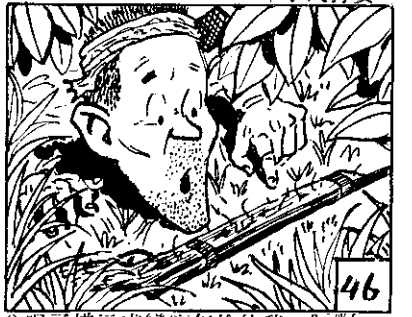
46 ？呢了樣這成變麼怎槍的我，呀啊