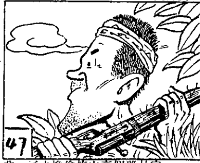
47 非，了去換偷族山高個那是定一！可不論理長箇的們他找去