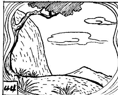
44 了有沒也人個上山，看一眼張！怪奇真，