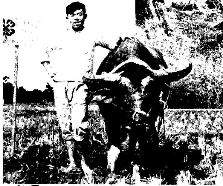
農復會協助防治豬瘟成功， 副業。