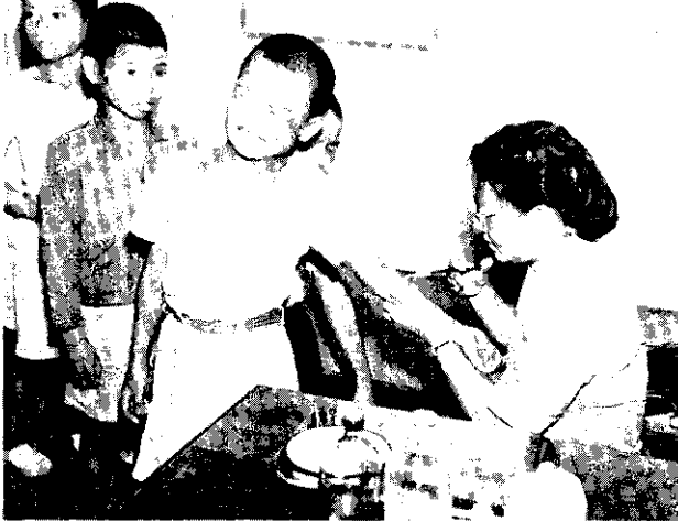
各鄉鎮農復會協助設立了 衛生所，增進農村民居的 健康。