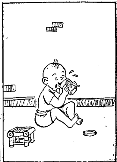
④ 阿福一時真喜歡，農藥當做食物，農將蓋開來，就將農藥毒落去。(不)知有毒食落去。

▲為害甘蔗的五種螟蟲，產下的卵都不一樣。除黃色螟蟲以外，都是排成卵塊。卵塊的排列方法各不相同，專家們一看就知道是那一種螟蟲產的卵。