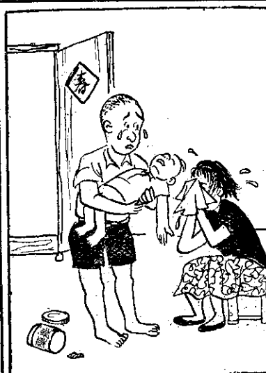
⑤ 阿勇某冠(夫)某返時，阿福在倒桌腳邊，父母看見(速)緊抱去，可已借經死毒。