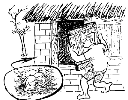
(門窗的舍豬好關意注要天冬)