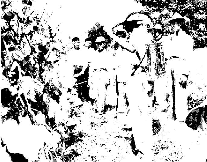
農友們已學會了如何噴射誘殺劑。

瓜蠅是本省瓜類的主要害蟲，現在已有最有效的防治方法了。瓜蠅誘殺劑，由蛋白質和馬拉松混合而成，農復會補助鳳山熱帶園藝試驗所做了三次示範防治，得到極滿意的效果。種植一分地的胡瓜，瓜農只要付出一百元的防治瓜蠅費用，可以增加收益三千元。這一防治方法，將於明年春天在全省推廣。