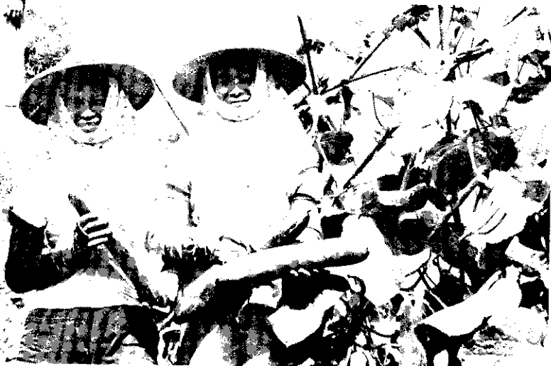
胡瓜大豐收，滅滅蠅。