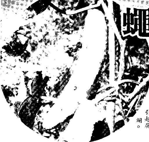
瓜蠅在胡瓜內產卵，引起腐爛。