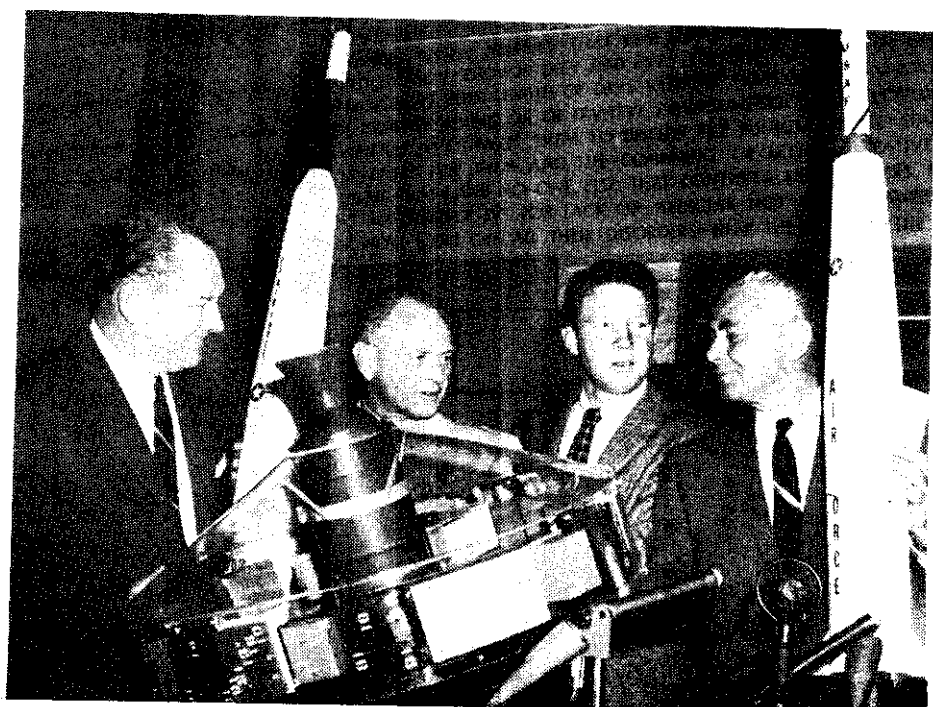
▶ 美國第一枚月球火箭已於十月十一日，突破地球引力的阻碍而進入無極太空，此一被命名為「先驅」的火箭雖然未能達到月球「附近」所期望的軌道，但是它已創下了人造飛器的高度新紀錄。圖示在華盛頓舉行記者招待會，討論「先驅」火箭飛行結果的四位美國著名科學家。