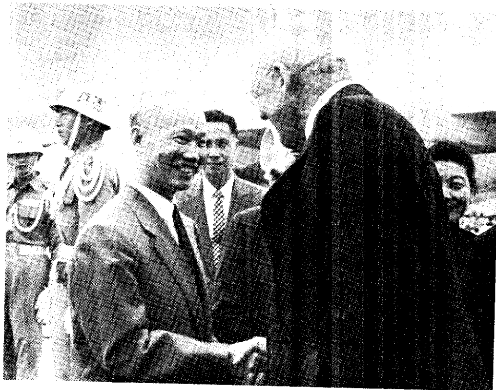
◀ 美國務卿杜勒斯（左）應中華民國總統之邀，來臺就共同有關問題舉行會談。圖示杜卿抵臺時，行政院長陳誠（右）迎於機場。