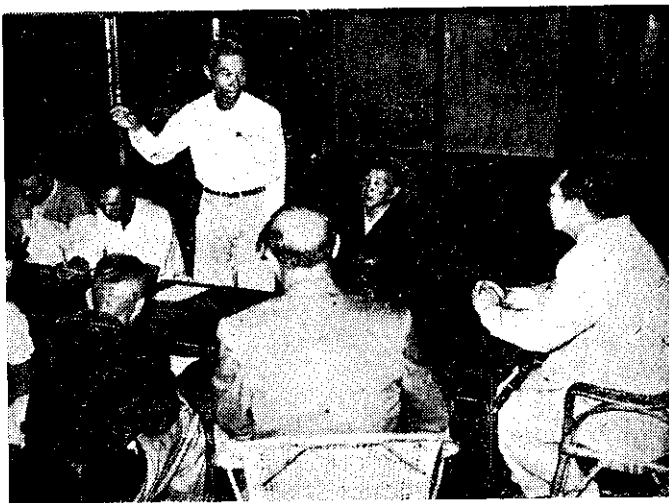
土地重劃協進會開會情形

這項改進的計劃，由於農友與政府機構的衷誠合作，得以順利進行。目前該地已因土地重劃成功，而建設為一溝渠縱橫，道路四通八達，坵塊排列整齊合理，呈現一種新氣象的區域。(FOD)