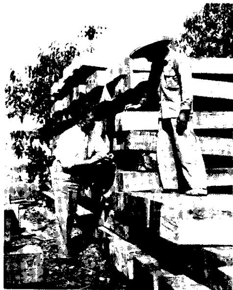
◦驗檢的前國韓銷運木枕