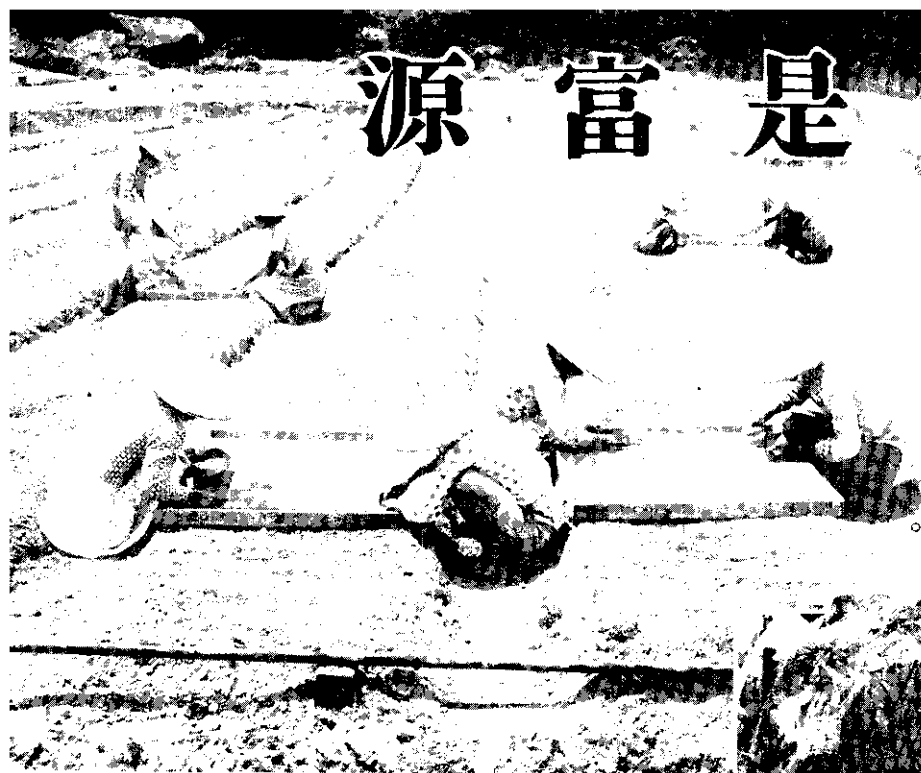
◦種播圃苗——作工備準的林造