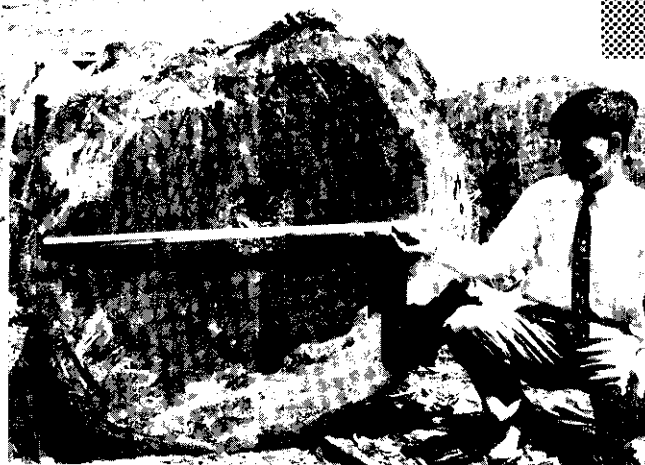
◦木檜大巨的上山平太

森林是富源。對國家經濟來說，木材可以換取外匯，對農業來說，它可以涵蓄水源，保持水土。森林也可以調節氣候，綠化山林。對個人說，種樹又何嘗不是生財之道呢！