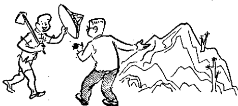
(圖畫化綠日早，力出民人，地出府政)