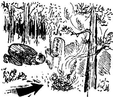
(災火林森起引能可，紙燒香焚)

本省的森林火災，大部份發生在交通方便，行人往來頻繁的地方。各位農友進入山林地區的機會一定不少。當你們進入山地時，請特別注意火源。在森林內吸煙，煙尾必需小心熄滅。生火取暖，必需離開樹木，並且把周圍容易燃燒的東西清除，在你離開以前，務必用水撲熄，或用泥土覆蓋。