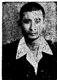
林永旭荔枝苗本園 啓敬旭永林 主園

荔枝種植希望者!!台鑾 荔枝果實採收期已經到了!敬請各界人士希望種植者撥駕光臨本園現場選取苗木是所歡迎!! 臺中縣潭子鄉頭家厝中山路十號