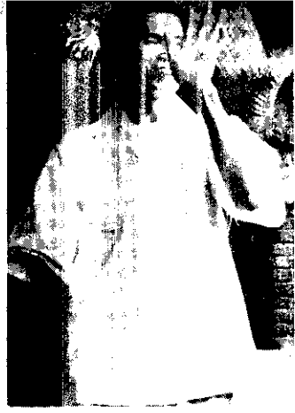
吃益生素長要多吃 益生素小豬不比豬大 ，說的握把有根友農立再賴 少最，的吃不比豬小。