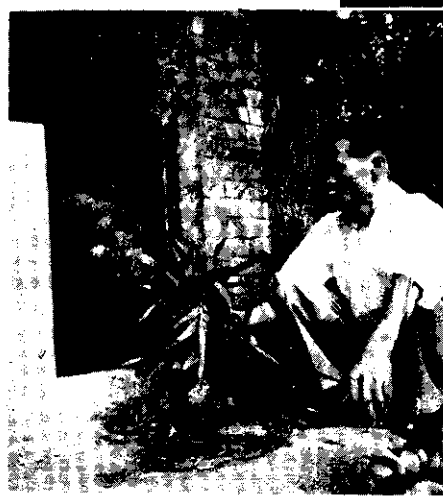
這隻吃益生素的桃園種母猪，豬又為賴農友帶來財富。

非常好用，所以我飼養的母猪，在受孕二個月後，就開始使用「益生素」，每天給七公分，足月時，生了七隻肥胖