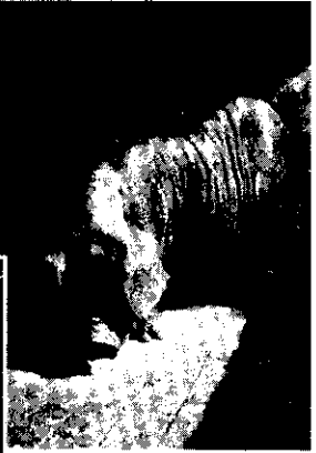
這隻賴農友最愛心，這隻母猪有四十隻乳頭，第一次能生七十隻小豬，非常非性，都好開了門，不都門。出房門一步。