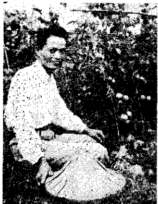
(友農喜賴的中國茄番)

在〇・〇七公頃小小的面積裡，一年中，收穫了價值一萬四千餘元的生產物。除去生產成本所費約五千元，也有九千餘元的利益。我家十四個人的生活，靠這副業的收入，已經得到很多的幫助與改善。但是這成果，還得歸一部份功勞給農會推廣人員與「豐年」的指導。（應振義代寫）