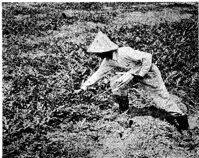
期日的果結始開明標，籤竹支一掃旁瓜西粒一每

西瓜在寶山鄉，還算是新興作物，黑皮的蜜寶，以前也沒有種過，農友們對於指導人員推行的方法，都能澈底執行。例如每一粒西瓜旁邊，都插了一支竹籤，上面寫明結果的日期。