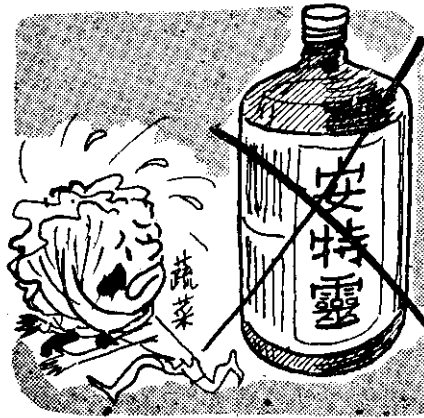
(上菜蔬在用以可不對絕靈特安)

材料，就立刻在本刊上發表。我們盼望有關當局重視這個問題，對於劇毒農藥的製造銷售等，從速訂出切合實際的規定，採取適當措施，以確保農藥應用的安全。同時，我們也深切盼望農友們用藥時，一定要按照規定的方法，以免發生意外，還希望大家注意本刊發表的有關農藥的文章。