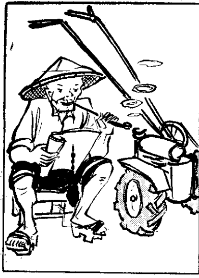
⑥中一甲愛日，日七，息出着日，食日，直費所免不。