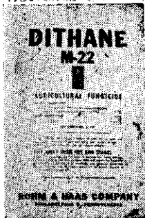
大生二十二可濕性粉劑三磅美國原裝

用「大生二十二」粉劑加水五百倍，十公畝瓜地約需「大生二十二」粉劑五磅，分為 6—8 次噴射。尤應注意早期預防。當蔓莖開始伸展時，每隔 7—10 天噴射一次。噴藥時應注意全面均勻週到，瓜株下部之葉莖生長較為濃密，病害最易發生更不可疏忽。瓜葉表面生有絨毛，葉液不易附着，應於噴藥之前，在葉液中加些「出來通 B 1956」粘着劑以增強藥劑性能。