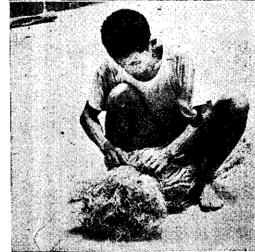
(晒 乾 的 原 料 麻)