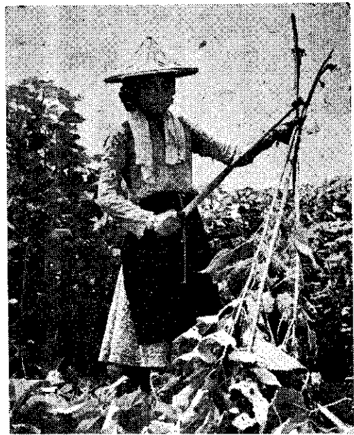
(收 獲 苧 麻)