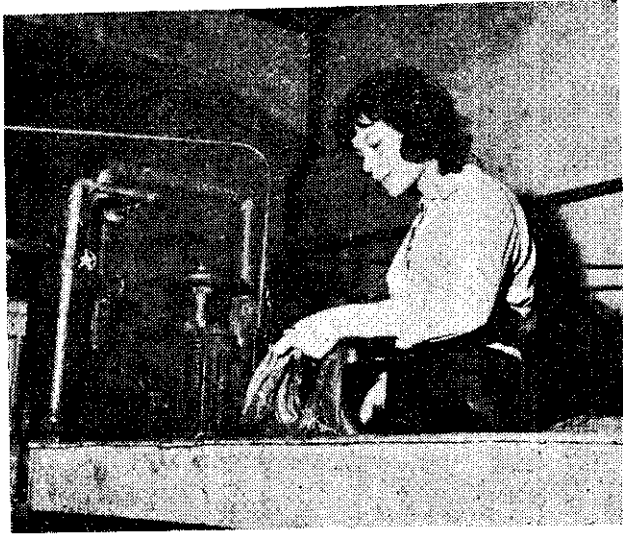
(麻 苧 洗 漂 劑 藥 用)