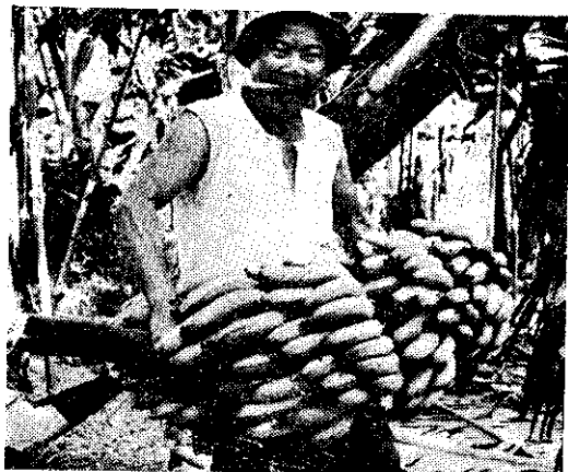
(陳肇修農友收刈香蕉的情形)