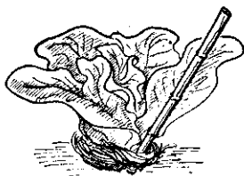
（搖動防止支柱搖動）

③在花蕾開始出現時，葉面噴射百分之〇·三至〇·五的尿素液，能使花蕾肥大，增加產量。