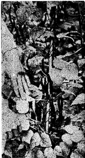
(形情的鼻鼻實結豆菜莢紅)

註：對這新種菜豆有興趣的農友，請再看本期七頁與二十頁。採種栽培的方法與普通栽培一樣。