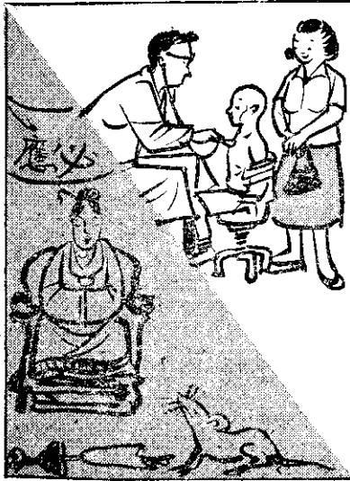
⑥ 咱人（我）們有病着醫要， 王姑那裡會保庇， 真多香客車跌死， 嘉茂（幸）阿林無去趕。