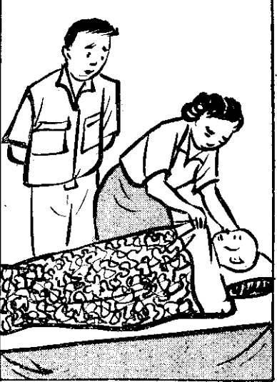
④ 年林四十四外， 單孤子叫潤阿， 阿林庭某（夫）心磨（煩）， 因爲潤阿病大（重）。