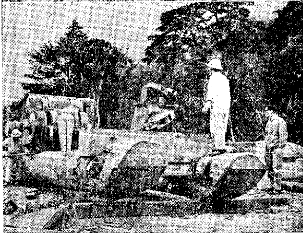
(船型滑木架，運送伐木機械。)

臺灣森林蓄積，經農復會調查結果，在不易到達地區，有八千多萬立方公尺，其中有很多是高價的針葉樹材，就要逐漸腐爛損失。大雪山森林以工業方式開發後，由於綜合經營的利潤高，週轉快，可以從大雪山開發所得的盈餘，投資開發其他地區的森林。