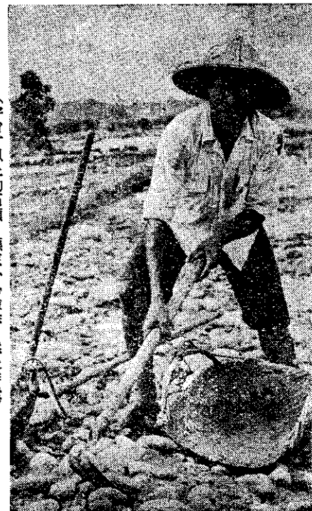
(半台寸以上的石頭，應該小心檢除，然後作畦)