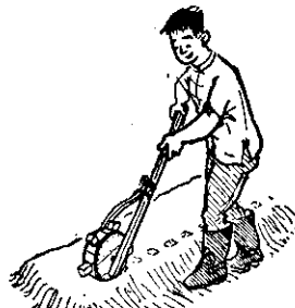
(穴開器穴開距定用)

畦邊。 洋蔥生育期，應防治病蟲害。蟲害以薊馬為害較大，發生時可用DDT或「馬拉松」防治。 病害以黑斑病為害最烈，用「大生」或「谷樂生」或「波爾多液」，每星期噴一次，防治，必須連續噴。 洋蔥葉面光滑，藥液不易粘着，宜加展濕劑或用粉劑，在朝露未乾時噴粉。 註：本刊贈送讀者的菜種，為了配合播種的適期，有一部份要等到九月初中旬才能寄出。請來信的讀者，稍為等候。 (完)