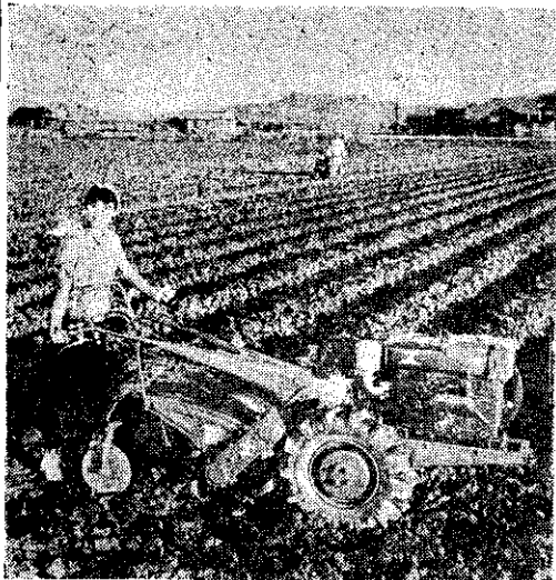
野馬牌富士號萬能耕耘機