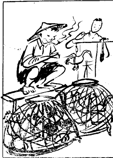
⑤ 有所謂是也鴨雞，(久不)久外免卵生鴨雞，(富豐)富豐真養營類卵，(差)輸較狹卵食肉無