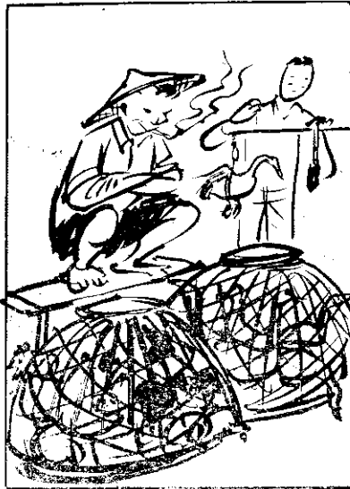
⑤ 有所謂是也鴨雞，(久不)久外免卵生鴨雞，(富豐)富豐真養營類卵，(差)輸較狹卵食肉無