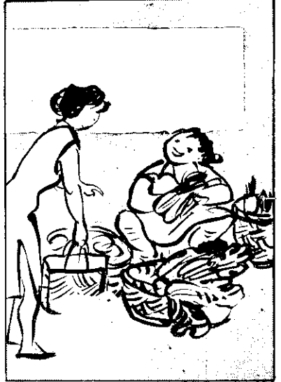
④ 有所謂村農菜蔬，(富豐)富豐也養類茶食，(差)輸較無肉比容，(差)輸較狹卵食肉無