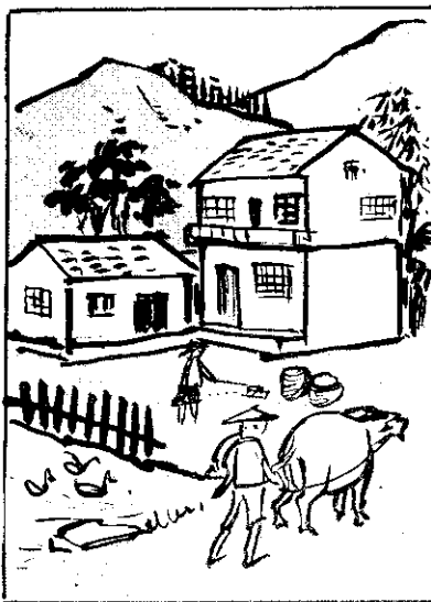
⑥ 衛生第一，知所，害敗有肉豬冥隔，財傷(又)關險胃必何，災救來省節如不