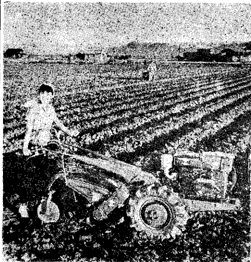
野馬牌富士號萬能耕耘機