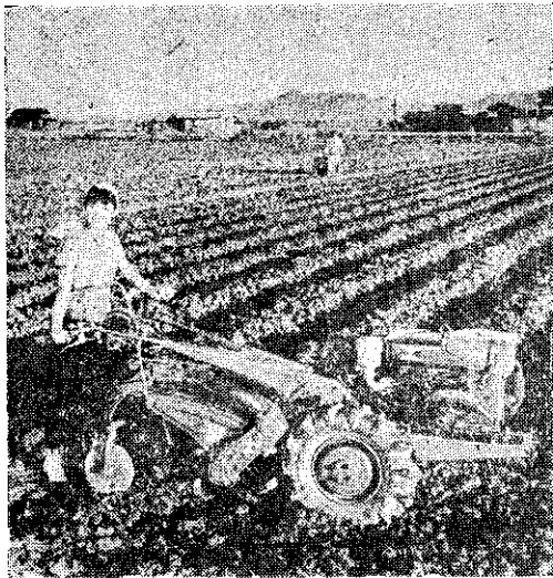
野馬牌富士號萬能耕耘機