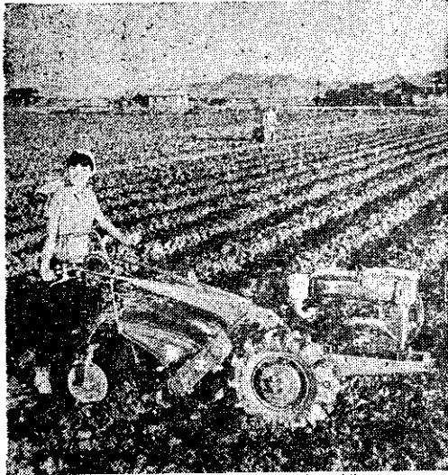
野馬牌富士號萬能耕耘機