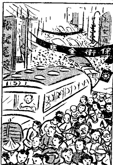
② 民鄉來路五北南 ，興高真熱鬧了看 ，身閃相客換馬車 。神精費意注張緊