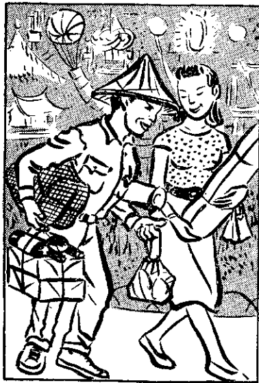
③ 市城全綠紅燈夜 ，天半放球氣粒三 ，弟兄的海人山人 。批大一物買觀參

臺灣南部自十月至翌年四月為乾燥期，適於番茄放任栽培。但是生育期間仍須注意病蟲害防治，每隔二星期撒佈「大生」(四百倍)及「馬拉松」(五〇%乳劑八百倍)藥液。