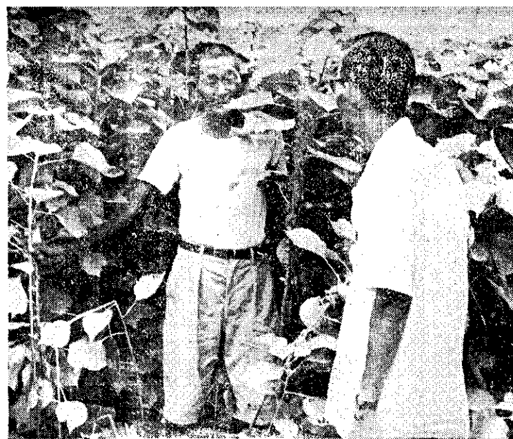
(賴學的好良長生上地坡山)