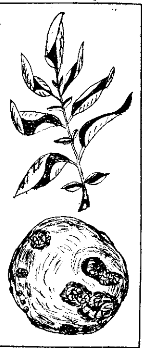
捲葉病病葉(上)與瘡痂病病薯(下)

(2) 盡力撒佈藥劑，尤其連日下細雨，多霧多露時，要特別注意。噴射「大生」四百倍液，或六斗式、四斗式「石灰波爾多液」，都可預防疫病、夏疫病發生。噴藥時，注意葉子正背兩面都噴到。又瘡痂病與黑瘧病的發生，與土壤鹼性有關