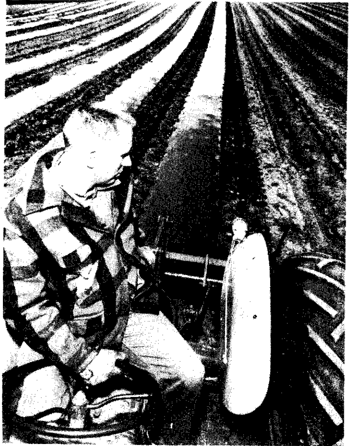
▲ 農人魏利茲用曳引機在田上鋪一層依利波林色膠塑。他，年一這。瓜西下種，口細道切上布在後然，布。倍三大半往較且量產，此一的最早都全是