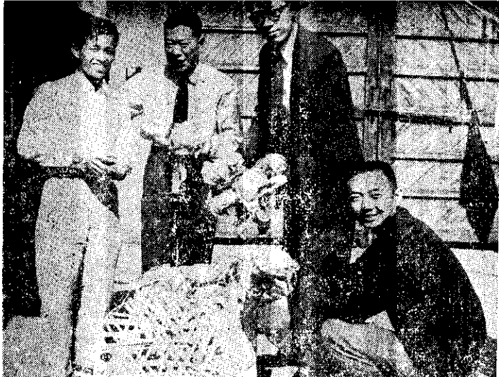
金試人同社才給送，巨萬球結的成種(人一第左)及農金萬謝