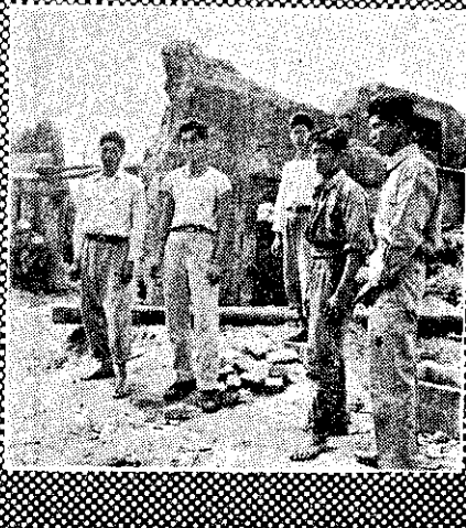
賴家的舊屋，只剩下斷牆殘垣。