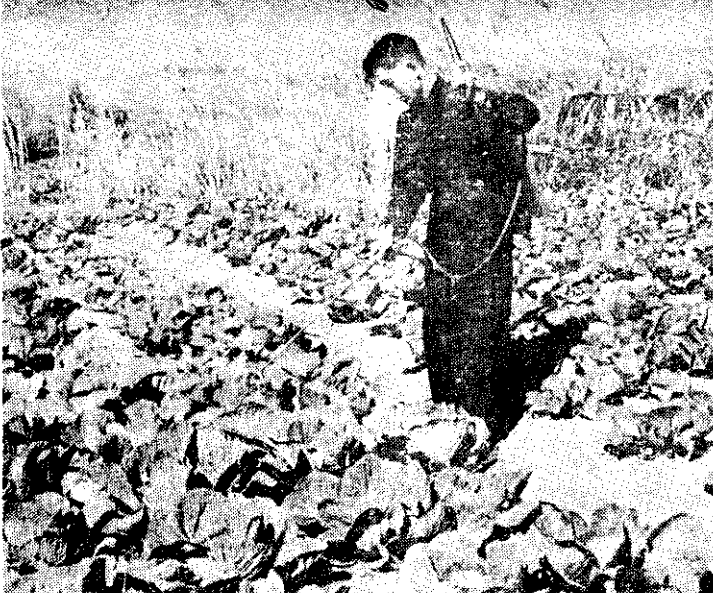
。葉農種三「精添魚純」與「精煙硫硫」、「松拉馬」用可，內期星三前獲收