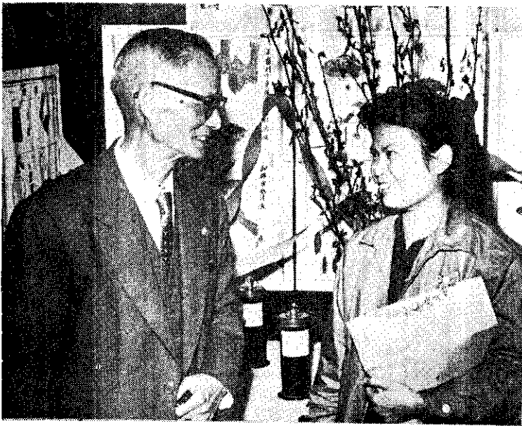
▲農復會主任委員蔣夢麟博士參觀四健會作業展覽，並向一位會員代表詢問工作近況