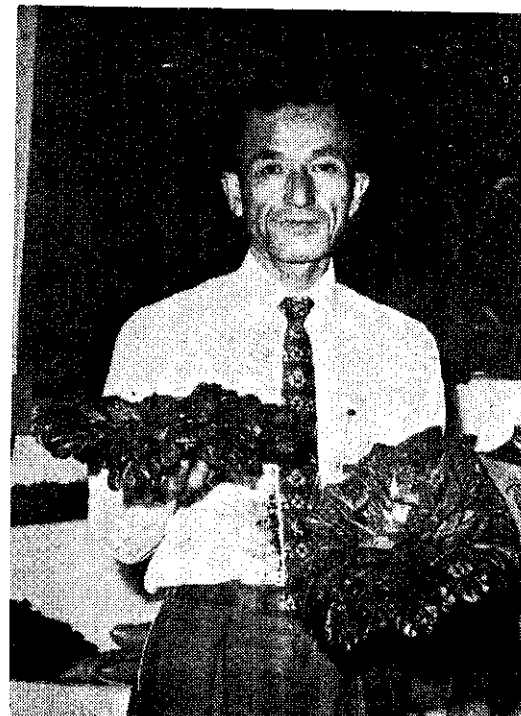
▶臺北市農會為慶祝四十九年農民節，於本月四、五兩日，舉行蔬菜品評會。會中展覽的「烏塌菜」，在本省還是少見的一種蔬菜。