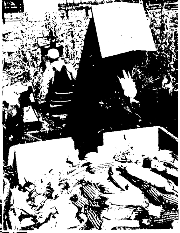
▲ 密蘇里州每英畝地平均產生四米玉。 十式蒲耳，多機用器收割。