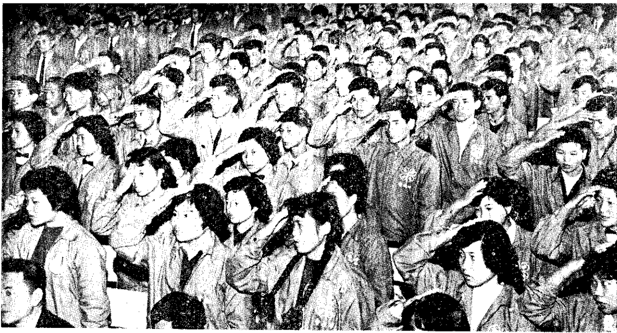
▲臺灣四健會於本月七、十一日在臺中市舉行第七屆年會。開幕典禮中，農林廳金陽鏡廳長擔任主席。上圖為會員代表在典禮中宣讀會員公約的情形