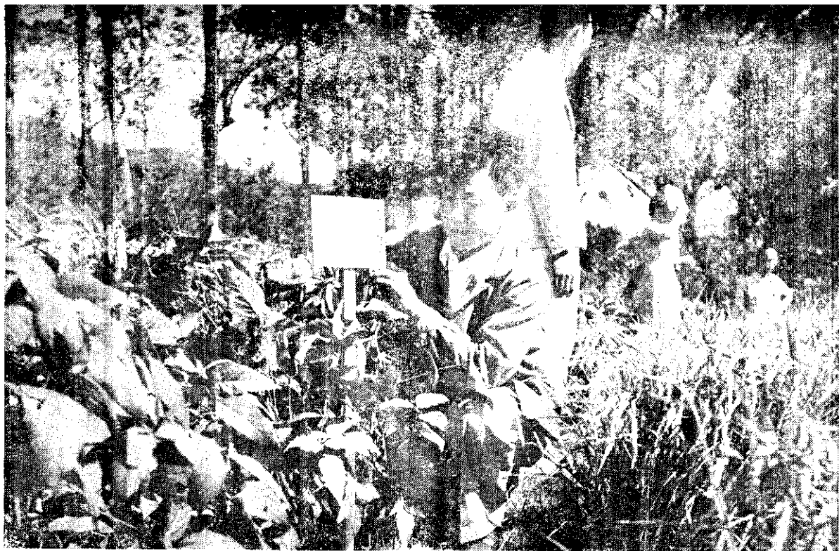
新 埔 鎮 田 叫 生 長 良 好 的 三 國 大 豆