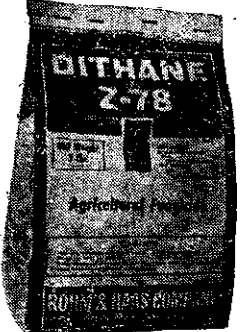
大生七十八可濕性粉劑三磅紙袋美國原裝

臺灣總代理 青象貿易有限公司 臺北市中正路1756號三樓 電話：27467 郵政劃儲臺灣第2156號 函索農藥說明書附郵票四角即寄